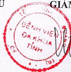
Trần Quốc Tuấn